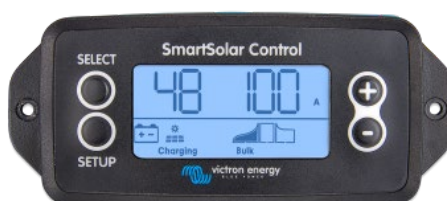
Écran à brancher SmartSolar