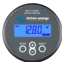
Détection Bluetooth : Contrôleur de batterie BMV-712 Smart