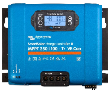
Contrôleur de charge SmartSolar MPPT 250/100-Tr VE.Can avec écran à brancher en option