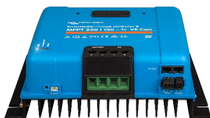
Contrôleur de charge SmartSolar MPPT 250/100-Tr VE.Can sans écran