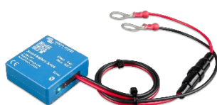
Détection Bluetooth : Sonde Smart Battery Sense