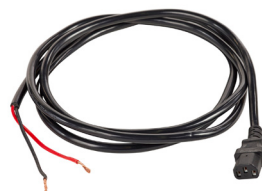
Cordon de 8 pi à extrémité ouverte inclus