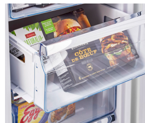
Plusieurs tiroirs faciles d'accès

Conçu pour optimiser les économies d'énergie, et d'une utilisation facile et fiable, le congélateur vertical CC Rétro Unique 175L UF allie un design classique de style rétro à des performances modernes. Ce congélateur vertical de 6,1 pi3 offre accès pratique aux 6 compartiments - Plus besoin de fouiller dans le congélateur à la recherche d'aliments.