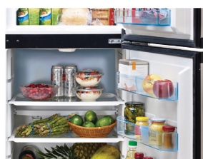
le système de refroidissement CC le plus efficace au monde