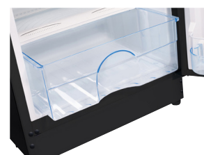
4 tablettes en verre et 1 bac à légumes