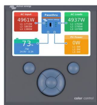
Color Control GX